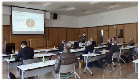
研修を受ける参加者

受講者からは、子どもや人の命を守ることを最優先に、地域としてできることをしていきたい、との声がありました。