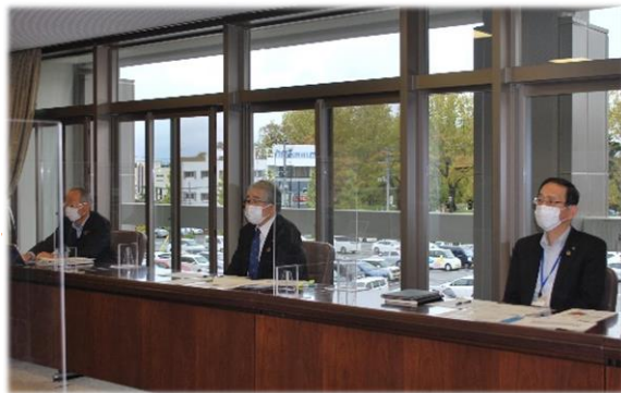
市役所から参加の市長及び両副市長