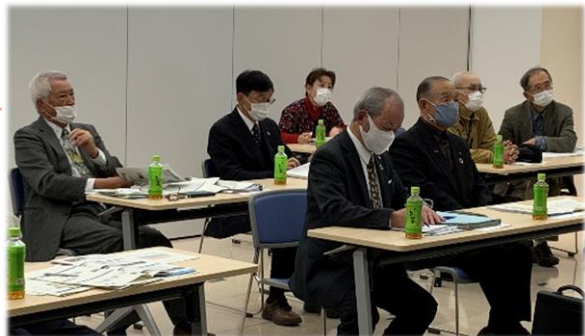
中央町内会連合会からの参加者