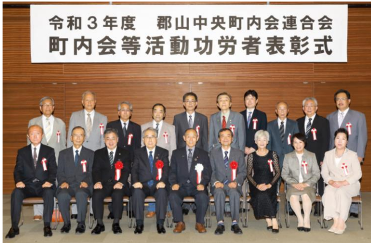
▶ 代表者へ表彰状が授与されました ◀ 集合写真